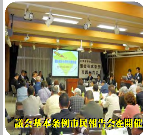
議会基本条例市民報告会を開催。

今年の3月議会で議会基本条例が制定されました。大東市議会は議会の運営や活動を条例に定め、市民の皆様のため、さらに親しみのある、開かれた議会を推進してまいります。「開かれた議会ランキング大阪府下第1位」の大東市議会ですが、公明党議員団は全国一の議会改革を目指してまいります！