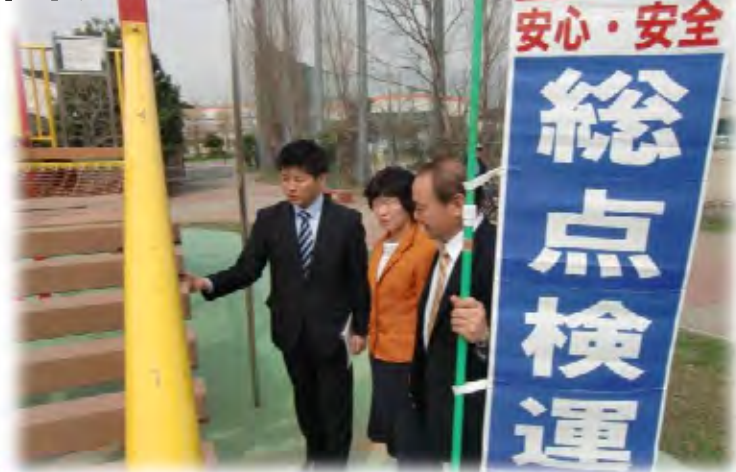
大東市内の公園の総点検を市議団とともに、参院選大阪選挙区予定候補の石川ひろたか氏