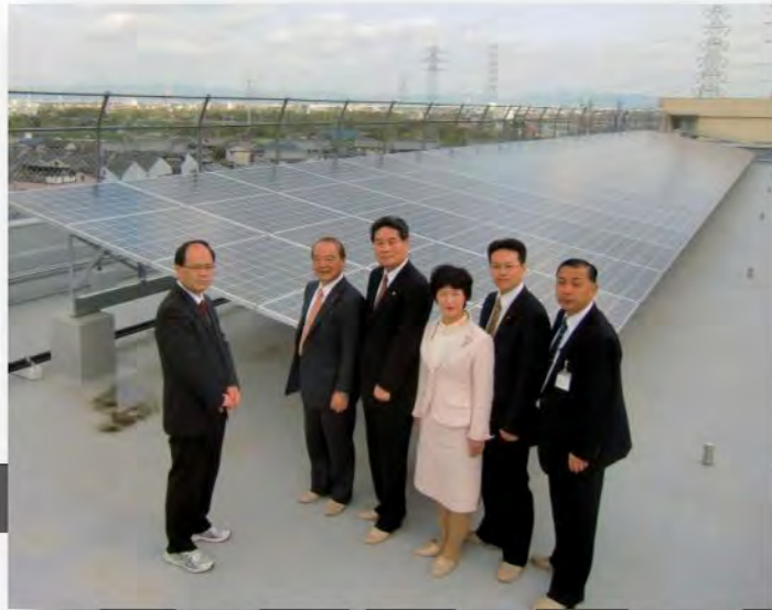
市内中学校の屋上に設置された太陽光パネルの視察を行う公明党議員団