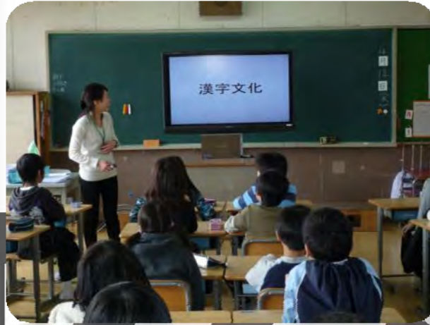
50インチの大型テレビを使用した授業風景。児童たちも興味津々、歓喜が沸く。